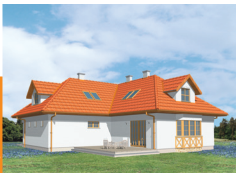
6 pokoi, gard., łazienka, wc, kuchnia, p. gospodarcze, garaż

przejszuj na kalke i przymierz do mapki syl.-wys.