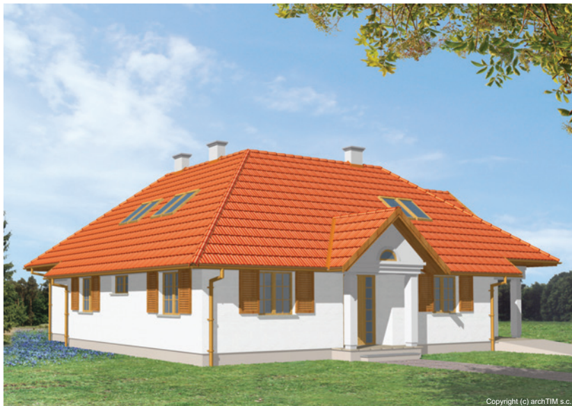
Projekt dostępny również w lustrzanym odbiciu. Dodatkowo do projektu można zamówić pełen kosztorys nakładczy.