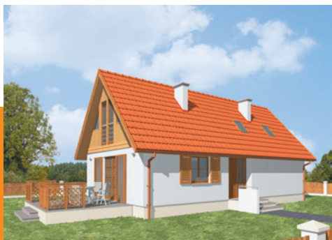
6 pokoi, garderoba, 2 łazienki, kuchnia, pom. gospodarcze